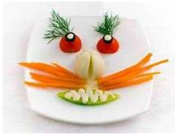
Gasthof Rössli Krinau