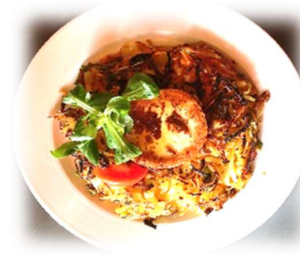
Gasthof Rössli Krinau